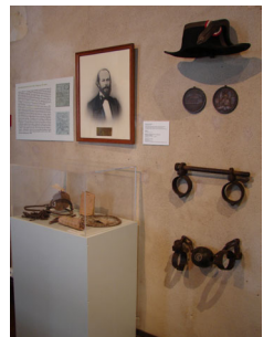
Vues des salles d'exposition

Médiation de l'exposition possible jusqu'au 2 octobre 2011 inclus